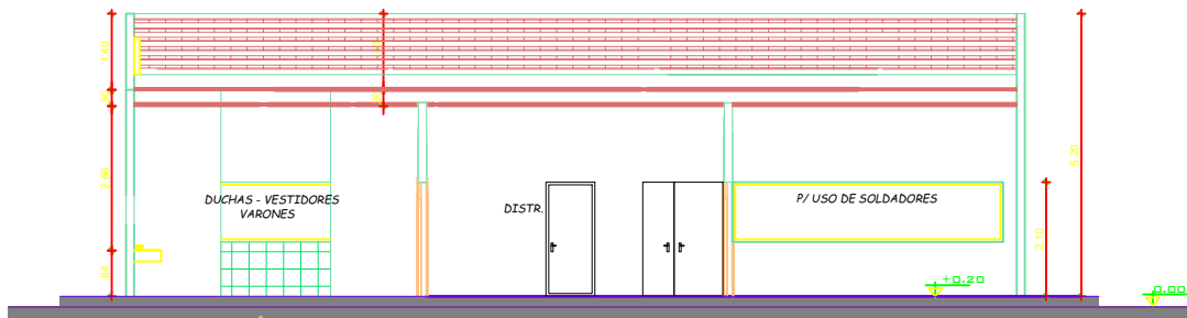
VESTIDOR CORTE A-A' Esc. 1 : 50